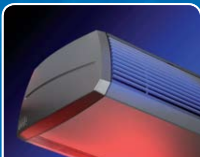
Comfort-luchtgordijn Model CA

Energiezuinig luchtgordijn. Altijd een comfortabele en optimale klimaatscheiding.