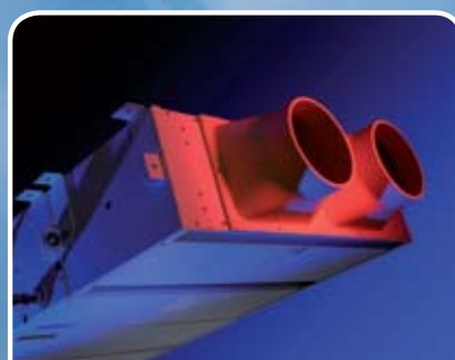
Modulaire ventilatorconvector Model PS

Projectmatig ingebouwd conform uw wensen.