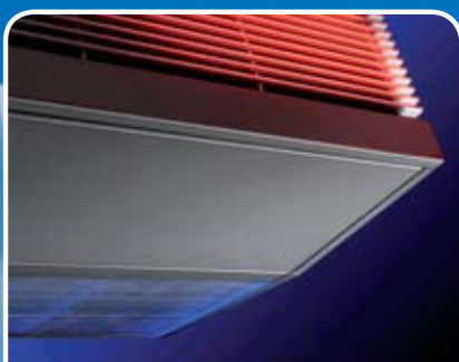
Industrie-luchtgordijn Model MAT

Robuust en krachtig toestel voor hoge industriële deuren.