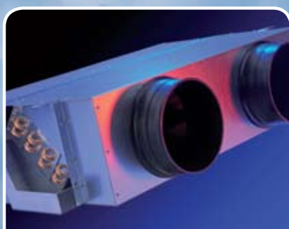
Projectventilatorconvector Model SL

Klantspecifiek verwarmen, koelen en ventileren.