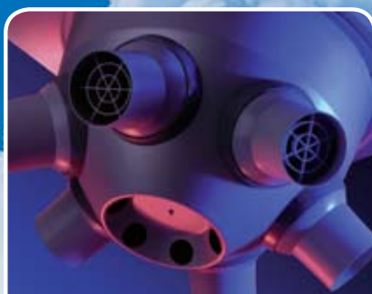
Luchtverwarmer Model NOZ

Vorkomt energieverliezen, ijs- en mistproblemen in vrieshuizen.