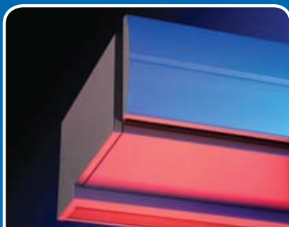
Comfort-luchtgordijn Model DoorFlow

Energiezuinig luchtgordijn. Altijd een comfortabele en optimale klimaatscheiding.