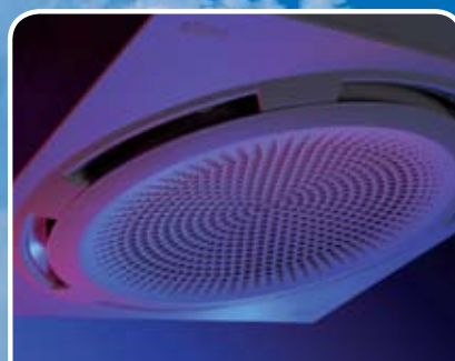
Cassette unit Model Comfort Circle

Voor verwarming en ventilatie van hoge ruimten (4-14 m).